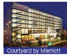
Courtyard by Marriott