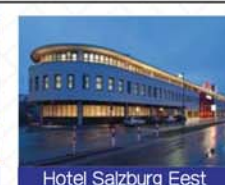
Hotel Salzburg Eest