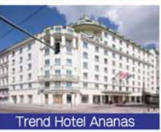
Trend Hotel Ananas