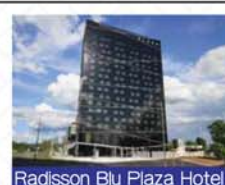
Radisson Blu Plaza Hotel