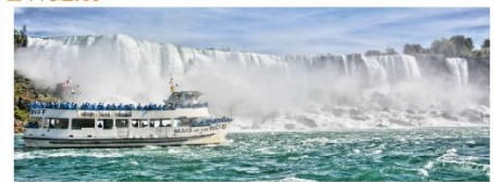
雾中少女号观瀑船

独家入住瀑布景区酒店，徒步游览尼亚加拉大瀑布更可观赏绚烂夜景！如有加境签证更可步行过境，同时领略尼亚加拉在美加两国不同魅力。