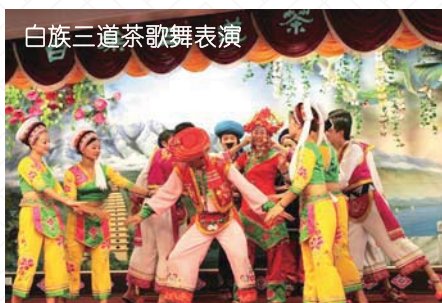
白族三道茶歌舞表演

Hotel: Xin Sheng Da Hong Sheng International Hotel or similar